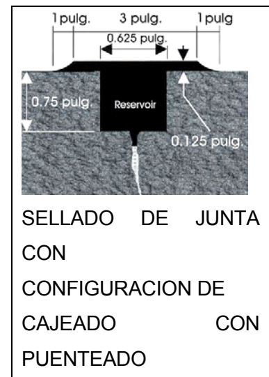
SELLADO DE JUNTA CON CONFIGURACION DE CAJEADO CON PUENTEADO

sistema de calentamiento indirecto (calentamiento mediante baño de aceite térmico) automático que asegure que la temperatura del sellador no deberá superar nunca los 180°C y la temperatura del aceite de transferencia de calor no superará los 240°C